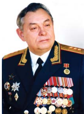
Последний 16-й Главнокомандующий ЗГВ-ГСВГ М.П. Бурлаков

Главнокомандующий Западной группой войск генерал армии Б.В. Снетков, активный участник Великой Отечественной войны, хорошо понимая ответственность за вывод войск и недопустимость геополитических ошибок, предложил схему вывода войск с территории Германии, где предусматривалось в первый год вывести десять процентов, во второй и последующие три года — по тридцать процентов. Но Б.В. Снетков был снят с должности, а вновь назначенному Главкому ЗГВ М.П. Бурлакову навязали ускоренный план вывода войск с выводом остатков — десять процентов в последний четвёртый год.